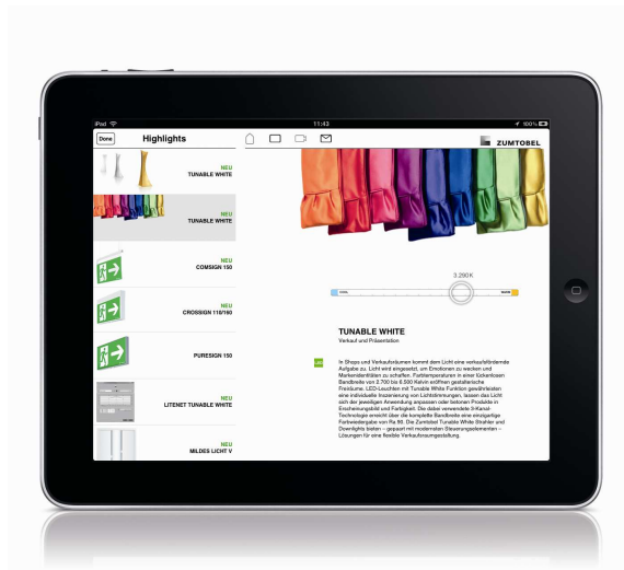
Bild 1: Eine neue, erweiterte Version der Zumtobel „Map of Light“ ist ab sofort im App Store erhältlich.