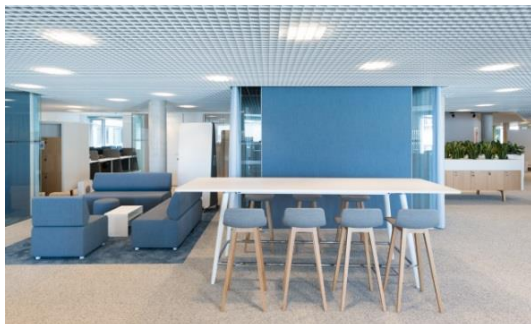
Bild 2: Post am Rochus – Ähnlich den zurückgesetzten und entblendeten Strahlern in der Shopping-Mall, verschwinden die Cetus-Downlights von Zumtobels Schwestermarke Thorn wie "unsichtbare Leuchten" hinter dem Deckenraster der Bürogänge. (Copyright: Zumtobel/Lukas Schaller)

Bild 1: Post am Rochus – Die Lounge mit in der Akustikdecke eingebauten Spots sorgen für ein klares Allgemeinlicht. Ergänzt wird es durch in die Decke eingebaute SLOTLIGHT-Lichtlinien. (Copyright: Zumtobel/Lukas Schaller)