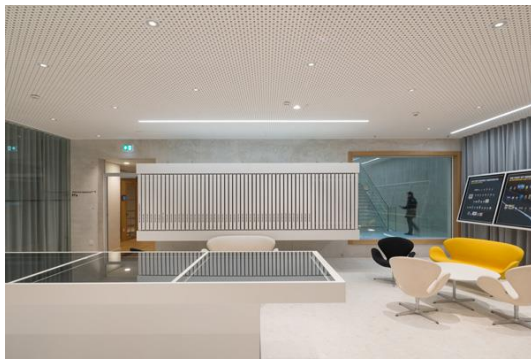
Bild 1: Post am Rochus – Die Lounge mit in der Akustikdecke eingebauten Spots sorgen für ein klares Allgemeinlicht. Ergänzt wird es durch in die Decke eingebaute SLOTLIGHT-Lichtlinien.