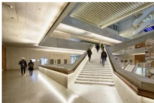
Bild 6: FH Muttentz – Die rampenartigen, fast drei Meter breiten Treppen stehen im Mittelpunkt der Architektur. Geradezu skulptural durchkreuzen sie das Atrium.