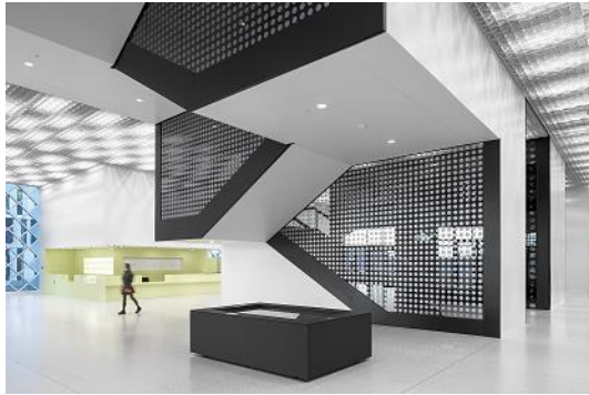
Bild 3: Futurium – Die Lichtrasterdecke im EG erinnert in ihrer Gestalt an die Rasterdecken aus den 70er Jahren, das Re-Design solcher Decken ermöglicht neue Ansätze zu finden.