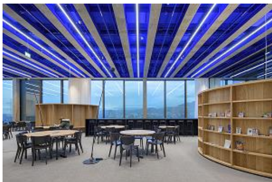
Bild 5: FH Muttenz – Gleich zwei Modelle der FREELINE sind entstanden. Optisch zwar identisch, unterscheiden sie sich doch in ihrer Optik und damit in ihren Anwendungsbereichen. Während das eine Modell durch die präzise Lichtlenkung der MPO für Büro- und Schulraumanwendungen geeignet ist, ist das zweite mit einer lentikulären Optik ausgestattet: Ideal, um Architektur zu betonen.