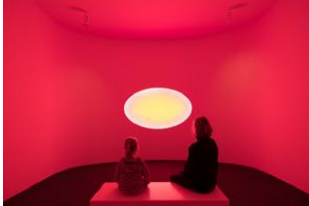
Bild 2: Das Werk aus der Serie Curved Wide Glass wurde fest in das Gebäude des Frieder Burda Museums integriert und bereichert so auch zukünftig die Kunstsammlung. © James Turrell; Foto: Florian Holzherr