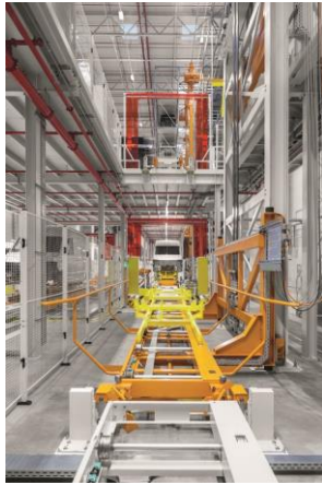
Bild 1: Volkswagen Nutzfahrzeuge fertigt im polnischen Wrzesnia die neue Generation des VW Crafter sowie das baugleiche Modell TGE von MAN. Das Werk umfasst eine Fläche von 220 Hektar und bietet eine Produktionskapazität von jährlich bis zu 100.000 Fahrzeugen.