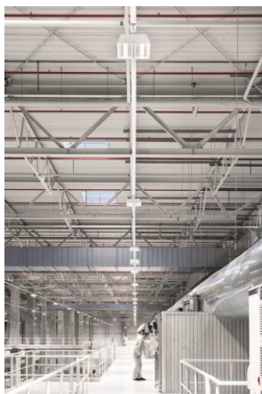
Bild 3: In der Lackiererei und in hohen Hallen ist die Hallenleuchte CRAFT L installiert.

Bild 2: Im Werk sind 16.000 TECTON-Leuchten auf einer Länge von rund 40 Kilometern verbaut.