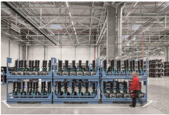
Bild 5: Durch die komplett auf LED-Leuchten basierende Lichtlösung ist das Werk das weltweit effizienteste Gebäude des Volkswagen-Konzerns.