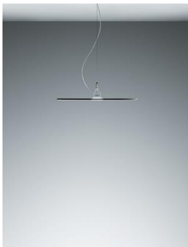
Bild 2: Die Pendelleuchte verfügt über eine Side-lit-Technologie: Bei dieser wird das LED-Licht der Lichtquellen in der transparenten Lichtleiterplatte ausgekoppelt und gleichmäßig von der Mitte zum Rand verteilt.

Bild 1: Eingeschaltet erscheint VAERO wie eine hauchdünne, fast schwebende Lichtscheibe. Im ausgeschalteten Zustand wirkt sie nicht weniger elegant.