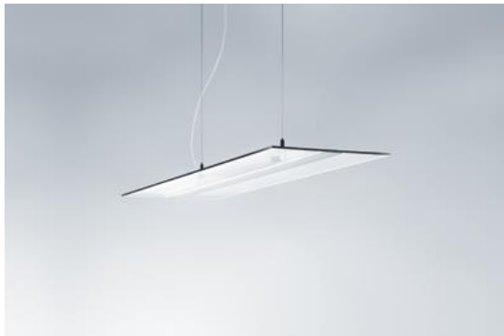
Bild 1: Eingeschaltet erscheint VAERO wie eine hauchdünne, fast schwebende Lichtscheibe. Im ausgeschalteten Zustand wirkt sie nicht weniger elegant.